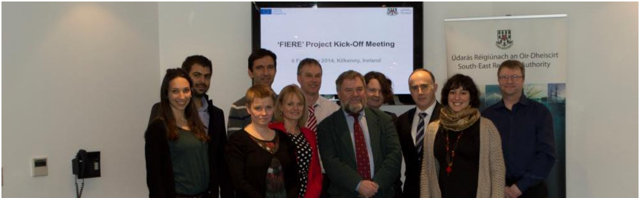
Samstarfaðilar FIERE verkefnisins á fyrsta fundi sínum í Kilkenny